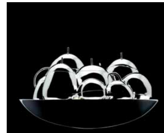
oben: Alessandro Mendini, Korkezieher „Anna Étoile“, 2010, unten: Kazuyo Sejima und Ryue Nishizawa SANAA, Service der Serie „Tea and Coffee Towers“, 2003