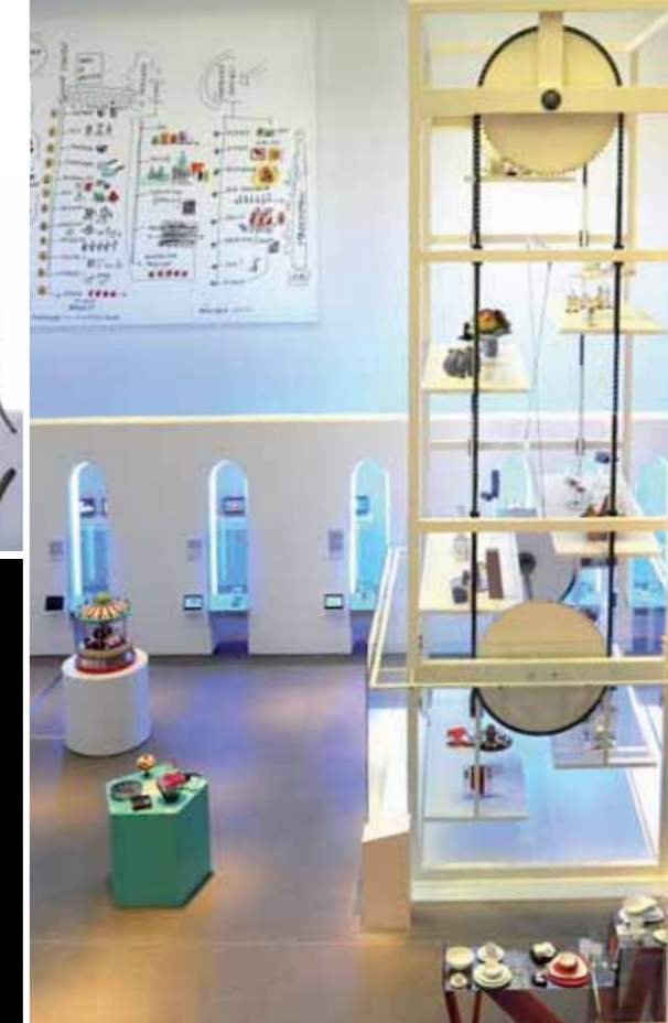
Kreative Ausstellungsgestaltung: Paternoster, Bogenwand mit Prototypen und einzelne Vitrinen.

für angewandte Kunst (dem heutigen Design) entspricht. Unsere Aufgabe besteht darin, kontinuierlich und unermüdlich zu vermitteln: zwischen den fortschrittlichsten Instanzen der zeitgenössischen, internationalen Kreativität im Produktdesign einerseits und den Erwartungen des Publikums andererseits. Unsere – ihrem Ursprung nach so typisch italienische – Arbeit wird von der Tatsache bestimmt, dass wir uns mit einer der sogenannten kommerziellen Künste von heute befassen.“