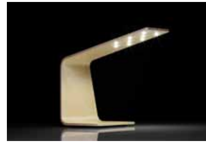
In die Tischleuchte «LED1» aus Holz sind LEDs eingelassen. Über Berührung des unteren Teils wird sie an- und ausgeschaltet.