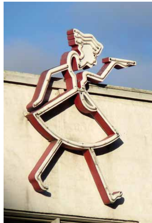
Wohrevue 1 2012