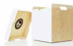
«M3» heisst ein Hocker, der – entfernt man seinen Deckel – ruckzuck in ein Stauraum-möbel umgewandelt werden kann. Er kommt in unzähligen Farbvarianten oder mit schwarzem Muster daher.

Wohnrevue 1 2012