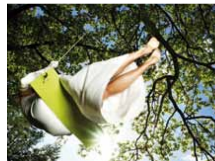
Für Kinder und Junggebliebene: Die Schaukel «Keinu» bringt Schwung in den Alltag.