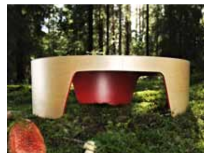
Der kreisrunde Beistelltisch namens «Kukka» ist ein typisches Produkt von Tunto: Schlicht und verspielt zugleich.