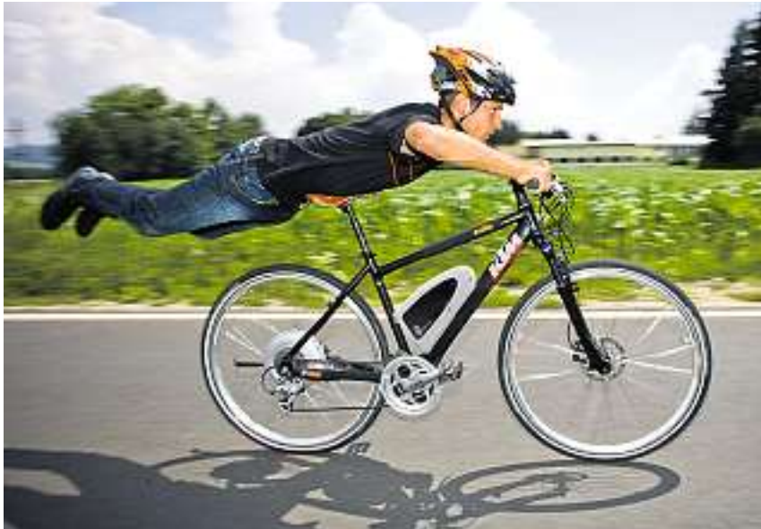
Die Elektroräder sind die gegenwärtigen Überflieger im Velogeschäft.

Der Velomarkt steht heftig unter Strom: Mit gegen 40 000 verkauften Rädern war letztes Jahr erstmals mehr als jedes zehnte ein E-Bike. Gesamthaft werden heuer in der Schweiz 100 000 Stromer zirkulieren. Kaum ein Händler und fast keine Marke mehr, welche die gegenwärtigen Trendseller nicht im Sortiment hat. Insbesondere auch sportive und prestigeträchtige Marken wie Scott oder Cannondale sind nun auf den rasanten Zug aufgesprungen. Das Image des Rentner-Fahrrads mit Hilfsmotor ist definitiv passé; dank immer neuen Typen wird die Kundschaft