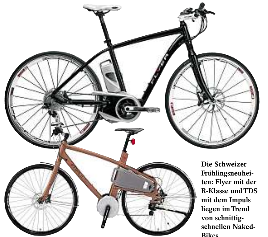
Die Schweizer Frühjahrsneuheiten: Flyer mit der R-Klasse und TDS mit dem Impuls liegen im Trend von schnittschnellen Naked-Bikes.

Nicht von ungefähr spielen die Schweizer Hersteller bei den Elektrorädern seit jeher eine führende Rolle – sie wissen am besten, welche Anforderungen unsere anspruchsvolle Topografie an den Antrieb stellt.