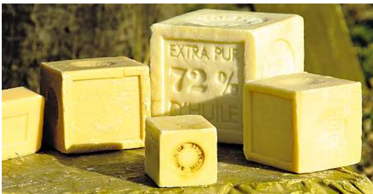
Die echte Savon de Marseille mit ihrer puristischen Form ist besonders reich an natürlichen Inhaltsstoffen.

www.durance-online.de www.philippechailoux.com www.marius-fabre.fr