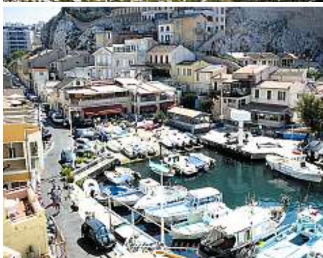
Unzählige Ausflugsboote verkehren den ganzen Tag vom Alten Hafen aus in Richtung Cassis, entlang der imposanten Felsküste der Calanques, welche auch von der Landseite aus erreichbar ist (Bild links und oben rechts). Pittoresk wirkt der Vallon des Auffes, eine stille Oase der Stadt.