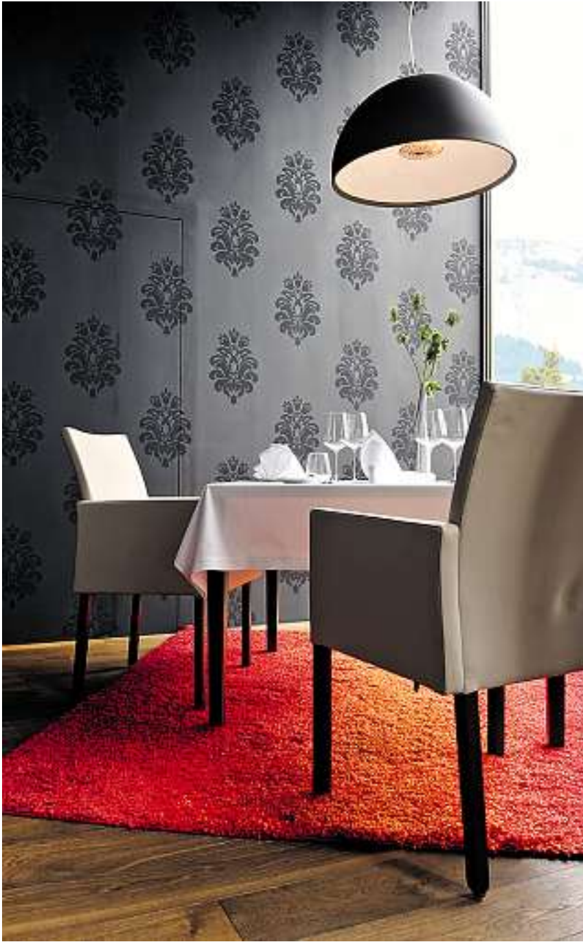
Das «Epoca» besticht besonders auch durch das Ambiente.

Um dieses Restaurant beschreiben zu können, muss man etwas weiter ausholen. Hotels gibt es ja unzählige im Kanton Graubünden, aber das «Waldhaus» in Flims stellt so manches andere in den Schatten. Um die Seele baumeln zu lassen und sich etwas Gutes zu tun, ist man hier genau richtig. Nicht nur Körper und Seele werden verwöhnt im «Epoca»-Restaurant steht die Gaumen-Wellness im Mittelpunkt. Das kleine Restaurant ist in sich zwar schon einmalig mit seiner unschlagbaren Lage im Park der Anlage. Durch die grosse Fensterfront scheint man fast mitten im Park zu sitzen. Und dann lässt man sich verwöhnen, wenn man sehr viel Ruhe will, am besten über Mittag.