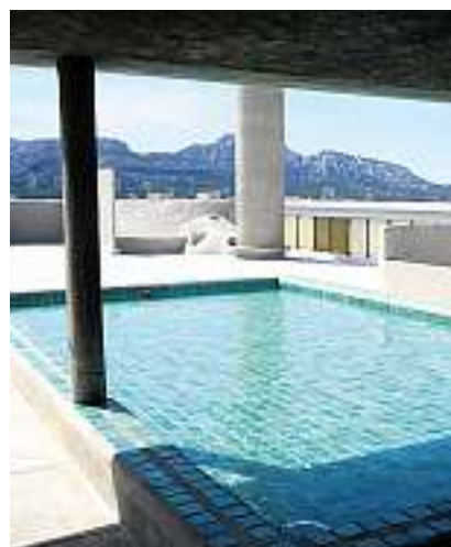
Das Hotel «Le Corbusier» ist reine Architekturgeschichte und erwartet die Gäste mit kleinen, feinen Kabinenzimmern und einer grosszügigen Dachterrasse.