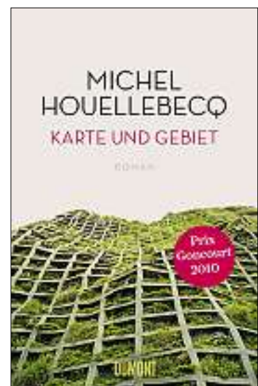
Michel Houellebecq: «Karte und Gebiet». Dumont-Verlag. 416 Seiten, 32.90 Franken.

Am Ende bringt der Autor Houellebecq die Figur Houellebecq auf bestialische Weise um. Das gibt zu lachen. Und nachzudenken. «Karte und Gebiet» ist nicht nur deshalb ein, wenn nicht das Buch des Jahres.