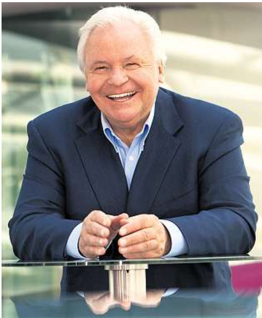
Eckart Witzigmann hat die deutsche Küche revolutioniert.

Wenn man nur die Bastelgruppe der Waldorf-Schule kennt, mag das so sein, aber der Spruch «Wer die Hitze nicht verträgt, sollte nicht in die Küche gehen», trifft die Ausgangslage sehr gut. Deshalb ist das kein Gerücht, sondern eine Tatsache. Die Arbeit in den ambitionierten Küchen ist körper-