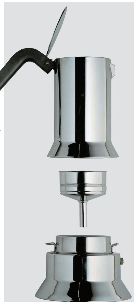
Richard Sapper Espressomaschine „9090“, 1978

„Anna G. ist ein gutes Beispiel für den Humor, der vielen Alessi-Produkten innewohnt. Genau dieser aber veranlasst manch einen Design-Puristen zum harten „Kitsch, Konsum, kauf ich nicht“-Vorurteil, das sich bis heute hartnäckig hält. Dabei wird jedoch oft vergessen – manchmal vielleicht schlichtweg aus Unwissenheit –, dass Produkte von Alessi ein breites Spektrum von Designkonzepten und -ideen abdecken und ihrer Zeit zuweilen weit voraus sind. 2006 wurde die Produktpalette in drei Marken unterteilt, die die ganze Design-Philosophie des Unternehmens umschreiben: „Officina Alessi“ als Marke für exklusive Produkte, „Alessi“ mit der Serienproduktion für den Haushalt und „A di Alessi“ mit Produkten, die sich (mit moderaten Preisen) an eine größere Käuferschicht wenden – Marketing muss eben auch hier sein.