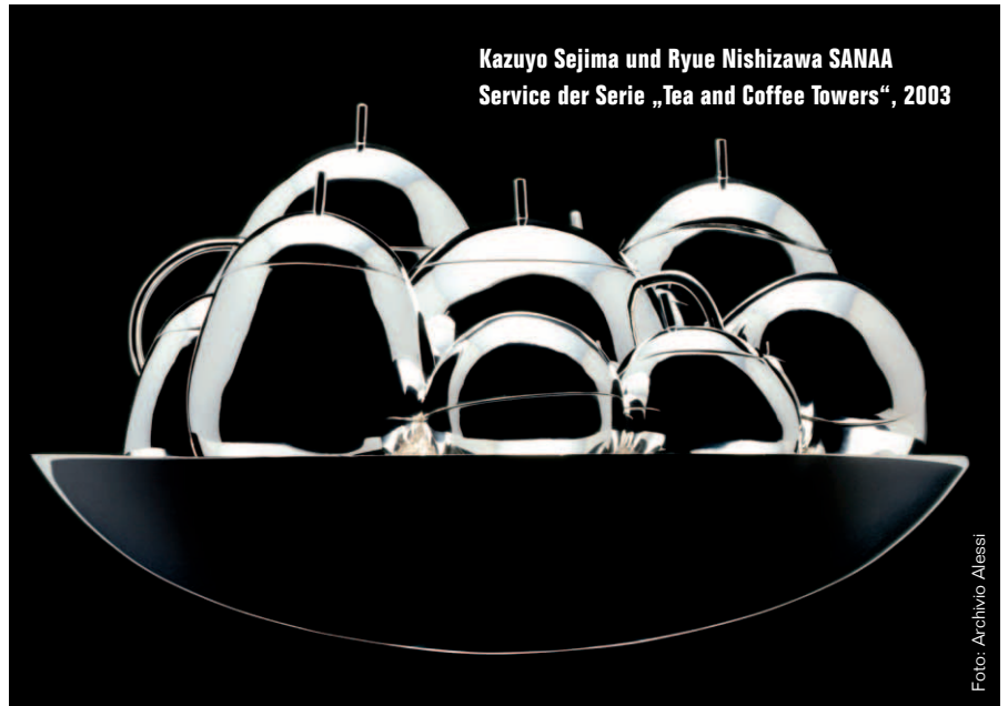
Kazuyo Sejima und Ryue Nishizawa SANAA Service der Serie „Tea and Coffee Towers“, 2003