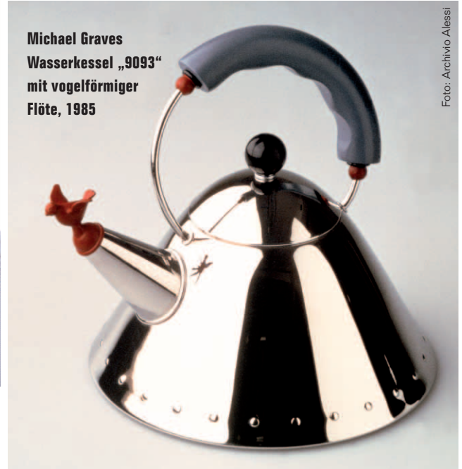
Michael Graves Wasserkessel „9093“ mit vogelförmiger Flöte, 1985

chen gehören weitere Metaprojekte, die auf den Regalen der Paternoster präsentiert werden. Sämtliche, jemals von verschiedenen Architekten entworfenen Exemplare der beiden Serien „Tea & Coffee Piazza“ (1983) sowie „Tea and Coffee Tower“ (2003) drehen sich wie ein Perpetuum Mobile. Und so steht der Besucher erstaunt vor dem „Fruit Basket“ von Kazuyo Sejima und Ryue Nishizawa (SANAA) oder erfreut sich am „Tea & Coffee Tower“ von Wiel Arets. Auf dem zweiten Paternoster ein ganz anderes Thema: Hier werden 100 Autorenavasen präsentiert. Jede fällt – bei gleicher Form – durch ein unterschiedliches Dekor auf. Kein Wunder, dass das im Jahr 1992 von