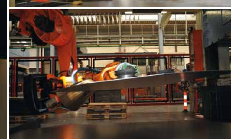
oben: Innovation aus Tradition: Die erste Badewannen-Pressenstraße aus dem Jahre 1958. Mit 1.000 Tonnen Druckleistung gelang es erstmals, Wannen aus einem Stück Stahl zu pressen