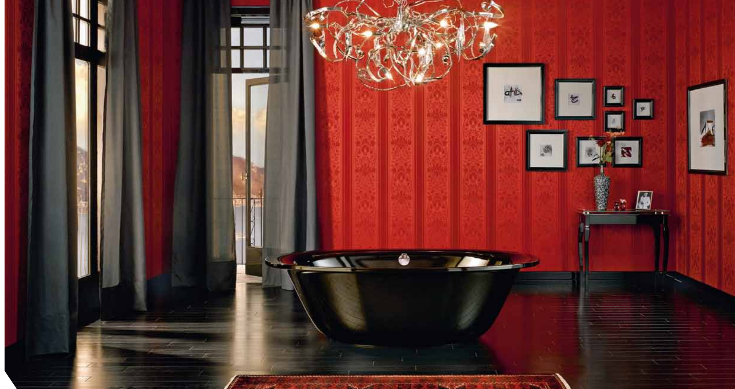
Schwarz liegt im Trend, auch als Farbe im Badezimmer. Das in diesem extravaganten Ton erhältliche, dank seiner selbsttragenden Verkleidung frei stehende Badewannenmodell „Ellipso Duo Oval“ von Kaldewei verfügt über einen Abperl-Effekt, sodass unschöne Kalkrückstände, Fingerabdrücke und Kratzer keine Chance haben

Das „Wolfsburg der Badewannen“ heißt Ahlen in Westfalen, eine knappe Autostunde vom nächstgelegenen Flughafen Münster-Osnabrück oder vom Ruhrgebiet entfernt. Ahlen hat knapp 60.000 Einwohner, aber eine beachtliche industrielle Tradition im Hintergrund: Mit der Industrialisierung hatten sich hier zahlreiche metallverarbeitende Betriebe angesiedelt und auf die Herstellung emaillierter Geschirre spezialisiert. Ahlen wurde eine Hochburg der