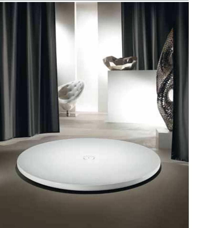
Badkultur eindrucksvoll in Szene gesetzt: Der neue Duschteller Piatto – auch wieder aus einer einzigen Stahlplatte gezogen – als Inszenierung mitten im Raum, während der Pool-Griff sicheren Ein- und Ausstieg gewährt

Bundesministerium für Verkehr, Bau- und Stadtentwicklung und der „Deutschen Gesellschaft für nachhaltiges Bauen“ entwickelte Gütesiegel „Nachhaltiges Bauen“ betrachtet und bilanziert Gebäude – die immerhin für fast die Hälfte unserer CO2-Emissionen verantwortlich sind – erstmals ganzheitlich über ihren Lebenszyklus. Die Folgen für die Bauwirtschaft sind gravierend: Ökonomisch betrachtet machen die eigentlichen Baukosten nämlich nur knapp 20 Prozent der Gesamtkosten aus – gewaltige vier Fünftel häufen sich dagegen erst in den Folgejahren über den laufenden Betrieb an. Der Fokus richtet sich also immer stärker auf die laufenden Unterhaltskosten – und damit auf Energiespartechnologien, Wärmedämmung oder die Rückbaufähigkeit. Das Gütesiegel „Nachhaltiges Bauen“ wird für Gebäude vergeben, bei denen die verbauten Produkte ihren Beitrag in Form einer ISO-zertifizierten Umweltdeklaration leisten. Bedeutet im Umkehrschluss, dass für zertifizierte Gebäude – und das wird in Zukunft der gültige Maßstab sein – nur ebenso zertifizierte Produkte in Frage kommen.