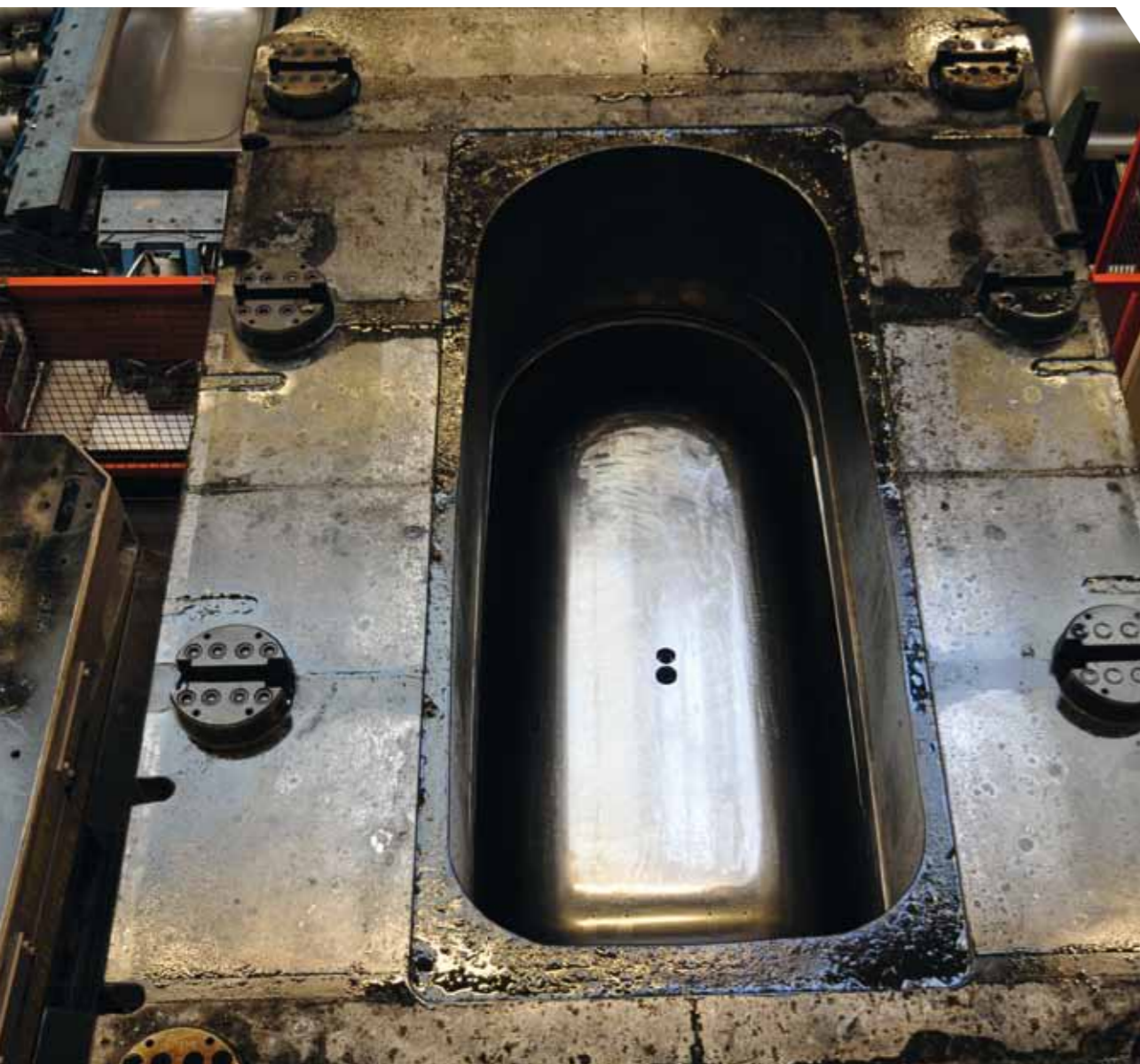
links: Die hohe Kunst der Verarbeitung: Der „Schwarzbereich“ ist das Zentrum der Wannenproduktion. Auch Stempel wie Matrizen sind Eigenproduktion, die Wanne wird im Tiefziehverfahren nahtlos aus einer Stahlplatte gezogen

Email-Industrie, aus der heraus auch die Franz Kaldewei GmbH & Co. KG entstanden ist. Heute ist Kaldewei der europäische Marktführer bei Bade- und Duschwannen – und Ahlen in Westfalen damit so etwas wie die Hauptstadt der europäischen Bad-Bewegung.