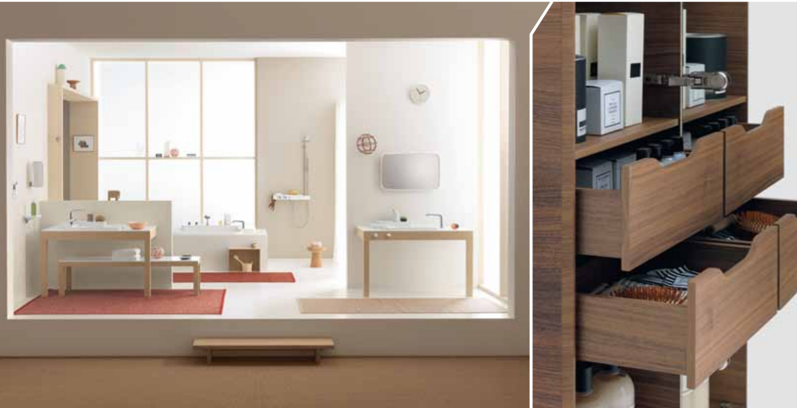
7 | 8 Komplettausstattung aus einer Hand: Essenz der intensiven Beschäftigung der französischen Designerbrüder Ronan und Erwan Bouroullec mit dem Lebensraum Bad ist die 85-teilige Kollektion „Axor Bouroullec“ für den deutschen Hersteller Axor/ Hansgrohe