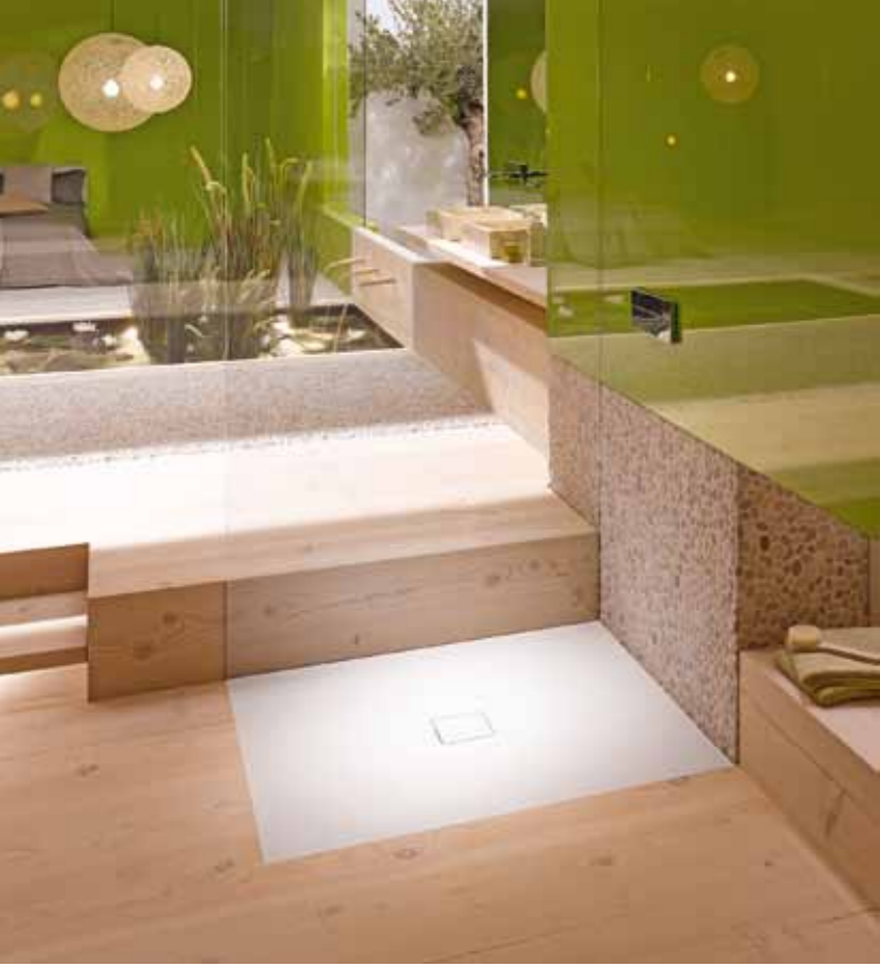
Product designed by Sottsass Associati