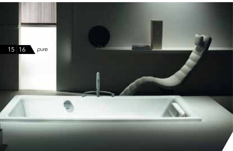
15 16 pure